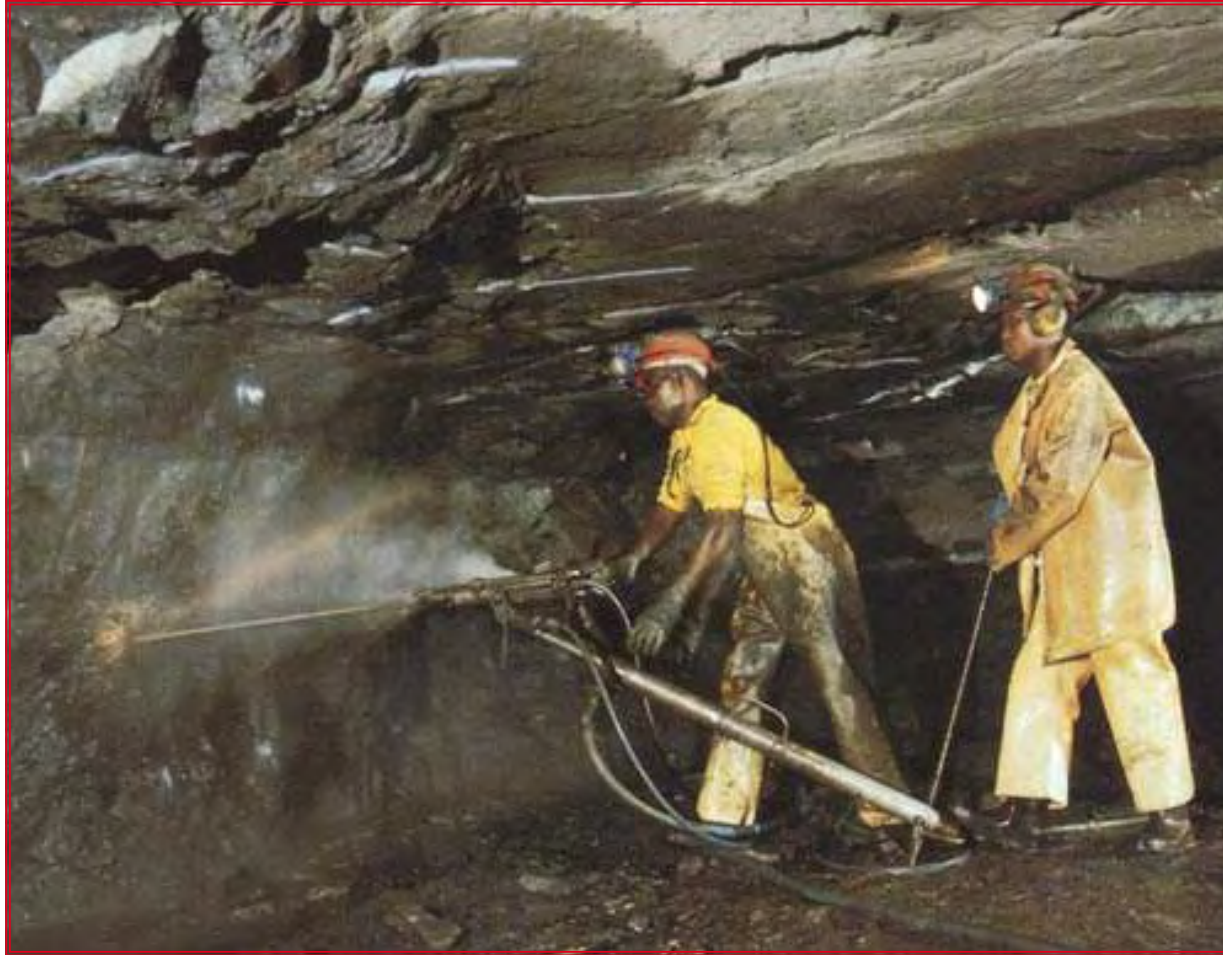
Samancor Chrome Mines. Drilling underground in one of the chromite seams.

Herkömmliche Gerbstoffe bergen teilweise